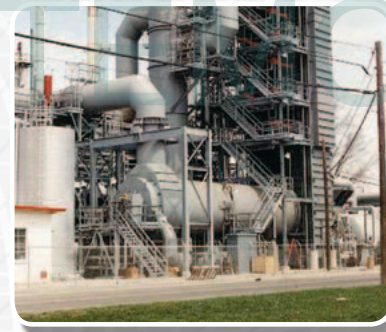
Котел Дожига Окиси Углерода

CERTIFICATIONS APPLY TO ZEECO HEADQUARTERS ONLY.