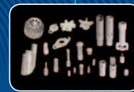
СЕРВИС И ЗАПЧАСТИ

СЖИГАНИЕ И ОХРАНА ОКРУЖАЮЩЕЙ СРЕДЫ. ЧИСТОТА И ПРОСТОТА.®